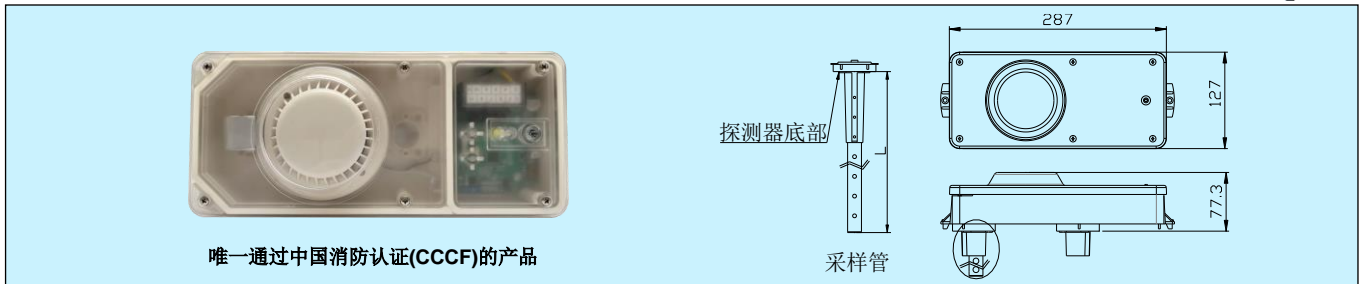
唯一通过中国消防认证(CCCF)的产品